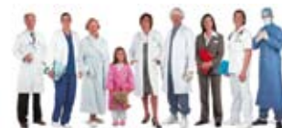
Infectie Preventie: Samen sterk

Infecties voorkomen is een gezamenlijke inspanning. Daarom, Samen Sterk!!